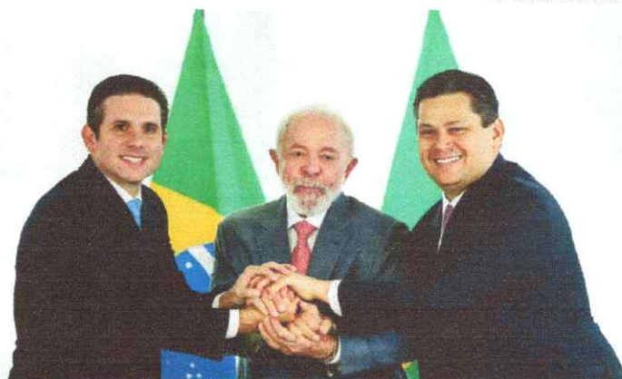
LULA DIZ QUE PRESIDENTES DO LEGISLATIVO NÃO TERÃO PROBLEMA NA RELAÇÃO POLÍTICA COM O PODER EXECUTIVO

PREFEITURA MUNICIPAL DE SÃO JOÃO DO GRANDE - PI AVISO DE LICITAÇÃO PRELIMINAR ELETRÔNICO Nº 002/2025 REPROCACAO O Município de São João do Grande - PI, através de sua preceptor, torna público, para o conhecimento de todos os interessados, que realizará a abertura de licitação na modalidade PRELIMINAR ELETRÔNICO Nº 002/2025, com prazo de início de recebimento de propostas no dia 31/01/2025 às 15:00h (quinze horas e trinta minutos), prazo final de recebimento de propostas no dia 13/02/2025 às 13:30h (treze horas e trinta minutos), e início da sessão para abertura de lances no dia 13/02/2025 às 14:00h (quatorze horas), que tem como Objeto: REGISTRO DE PREÇOS PARA CONTRATAÇÃO DE EMPRESA PARA CONTRATAÇÃO DE EMPRESA ESPECIALIZADA PARA PRESTAÇÃO DE SERVIÇO DE REGISTRO DE EMPRESAS PARA CONTRATAÇÃO DE EMPRESA PARA ABASTECIMENTO DE COMBUSTÍVEL NA CAPITAL TERESINA E CABADE DE CANTO DO BARRIL PARA ATENDER OS INTERESSES DA PREFEITURA MUNICIPAL DE SÃO JOÃO DO GRANDE-PI. O edital e seus anexos poderão ser acessados pelo site eletrônico: https://licitacoes.com.br. Mais informações Prefeitura Municipal de São João do Grande-PI, situada à Avenida São Francisco nº 9, Centro, telefone: 89-35810413, e-mail: pm@sjgpi.gov.br. São João do Grande (PI), 03 de fevereiro de 2025. Kátia Inês da Costa Agente de contratação